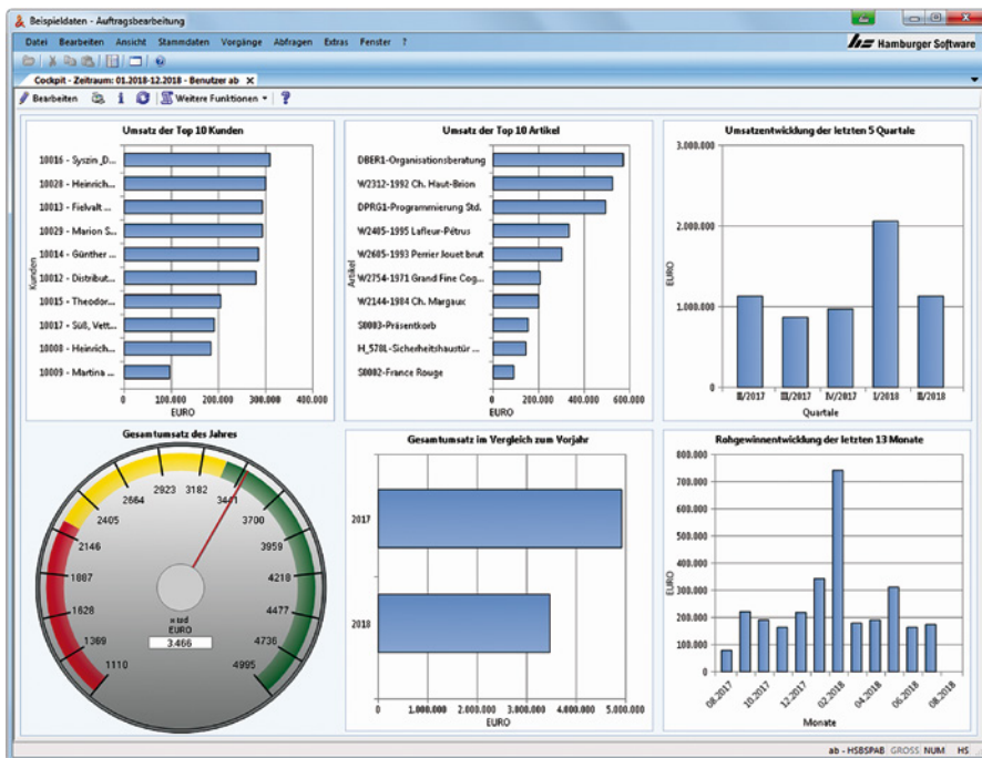
Transparenz auf einen Blick: Das Cockpit stellt wichtige Zahlen aus der Auftragsbearbeitung grafisch dar.